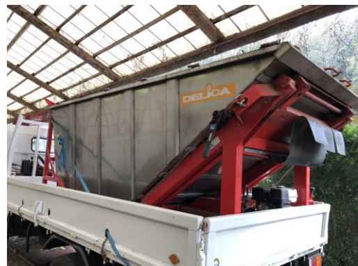
写真6 マニュアルスプレッダー