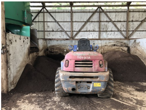
写真3 発酵済みの鶏ふん置き場