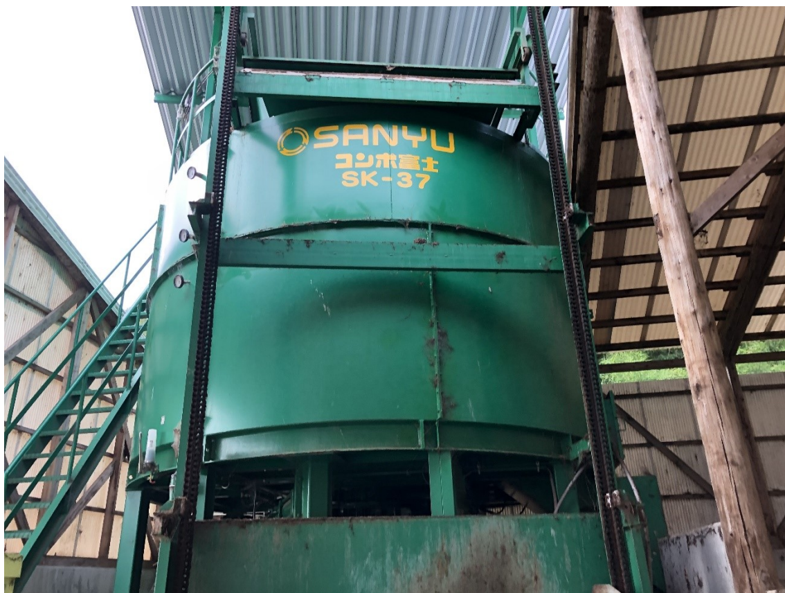
密封縦型堆肥化装置