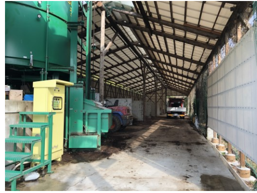
写真2 鶏ふん発酵処理場全景