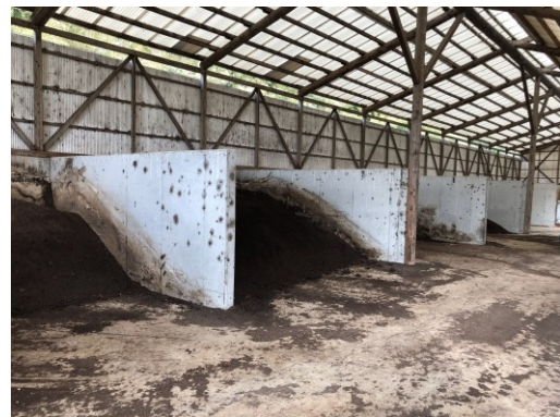
写真4 左のマスから、発酵済み鶏ふん、 水分調整用鶏ふん、生ふん+ 水分調整用鶏ふん、生ふん