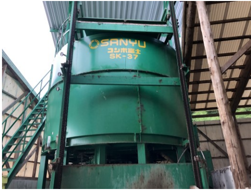
写真1 密閉縦型堆肥化装置