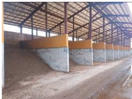
写真4 製品置き場（バラ売り用）