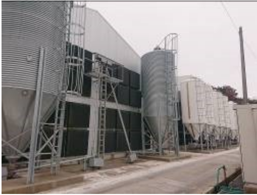
写真1 昨年建て替えを行った鶏舎