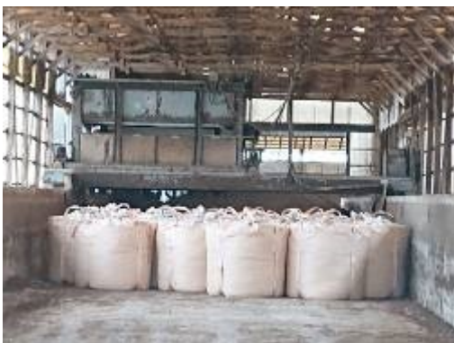
写真7 製品置き場（フレコン詰め）