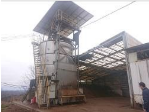
写真3 密閉縦型堆肥化装置