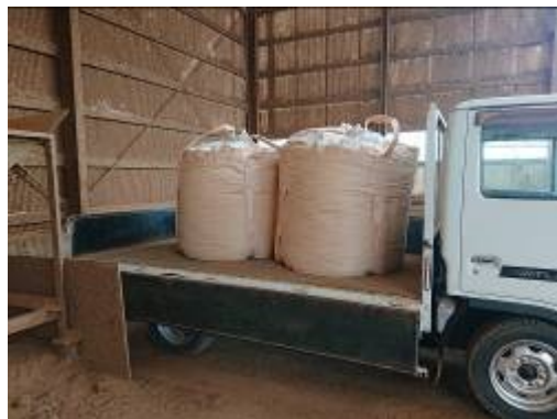
写真8 フレコン出荷の様子