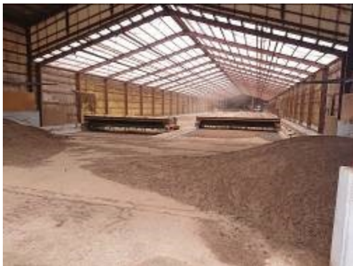
写真5 水分調整ハウス