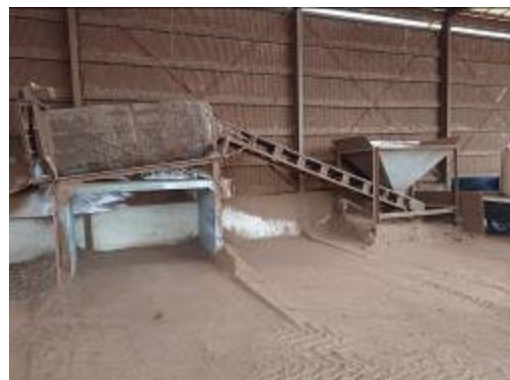
写真6 鶏ふんフルイ機（3mm目）