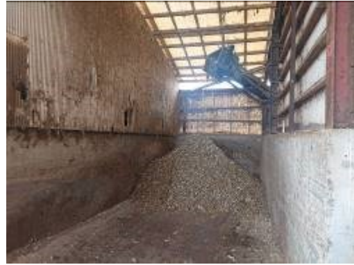
写真2 鶏舎から搬出される鶏ふんは ベルトコンベアで直接堆肥舎に運ばれる