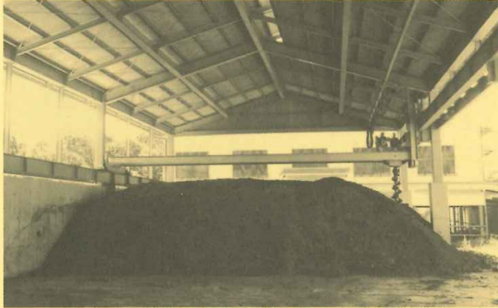
一次発酵 (右奥が縦型発酵攪拌機)